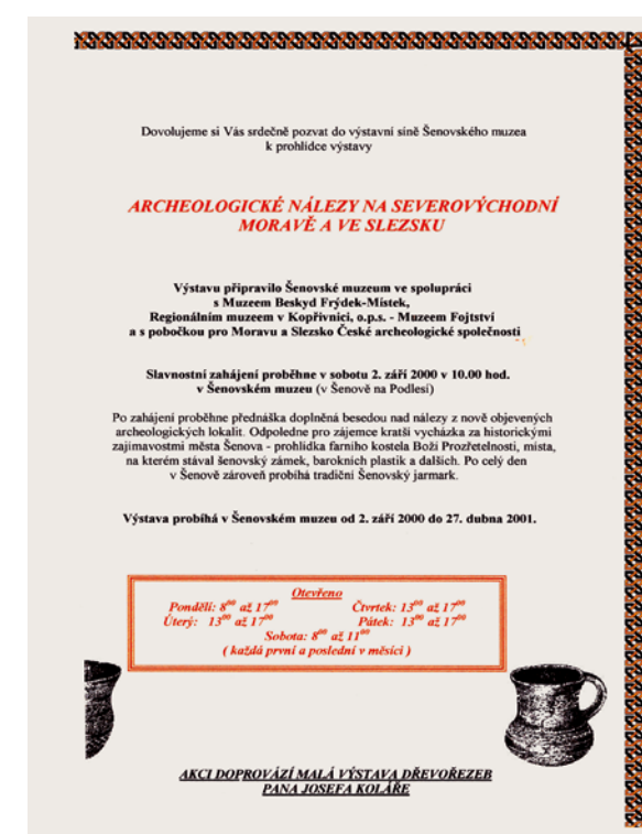
Pozvánka na archeologickou výstavu v Šenově v roce 2001, kterou uspořádalo Muzeum ve Frýdku Místku s naší spoluúčastí.