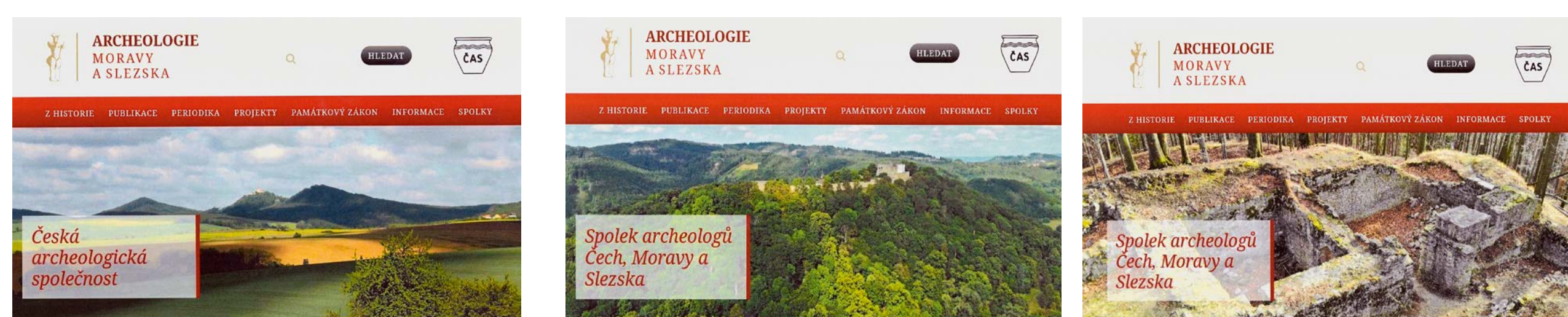
Střídající se obrázky na titulní stránce našich www stránek: Pohled na trojvrší hradisek Holý Kopec, Buchlov, Barborka v Buchlovicích. Letecký snímek zříceniny hradu Hukvaldy. Fotografie z hradu Šostýna u Koprivnice.

Naše www stránky vznikly v roce 2017 a můžete je nalézt na adrese: http://www.archeologie-ms.cz . Jejich vzniku předcházela peněžní sbírka, kterou jsme uspořádali v rámci naší pobočky. Vybrali jsme dostatečný obnos, který nám umožnil zaplatit nejen grafika, ale i poplatky související s jejich dalším fungováním. Pak následovalo postupně zaplňování jejich plánovaného obsahu, průběžné inovace i reakce na nové impulzy. A jak se nám to daří? Přesvědčte se o tom sami.