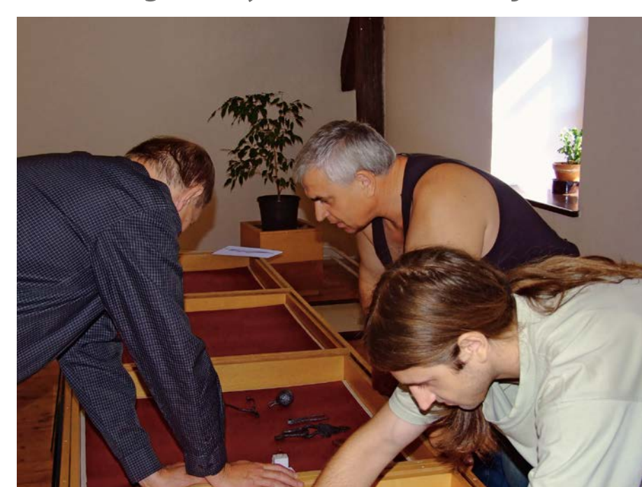
Naši členové z Oder při instalaci jedné z vitrín.

Archeologická výstava v Muzeu Fojtství v Koprivnici v roce 2007