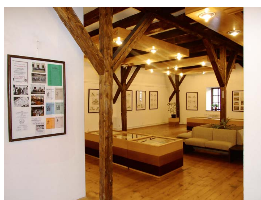
Pohled na výstavu v podkroví Fojtství.