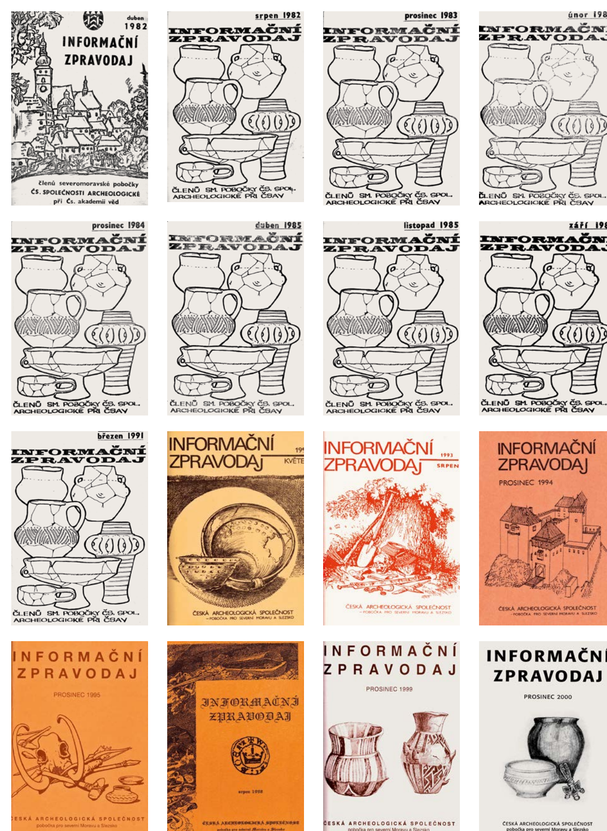
Informační zpravodaj Severomoravské pobočky Československé společnosti archeologické vycházel v rozmezí let 1982 až 2000.