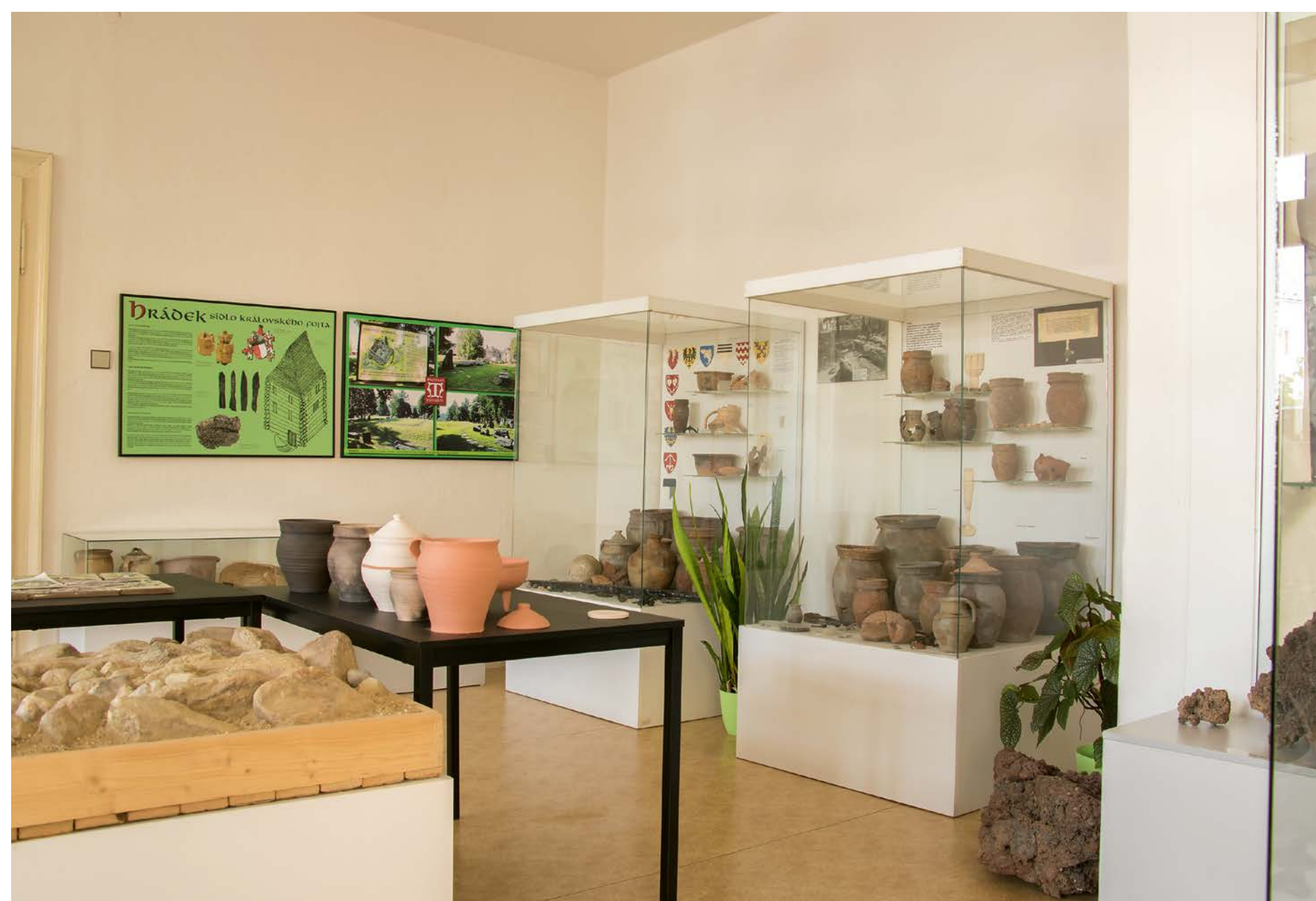
Pohled do expozice archeologie 2019.

plávaného Okresního vlastivědného muzea v Rýmařově, kterému v roce 1955 město přidělilo několik místností domu na náměstí Míru 6, v němž dnes muzeum sídlí. Na konci padesátých let však bylo založení muzea zamítnuto, část sbírek byla jako mírně poškozená zlikvidována, předměty náboženského charakteru vyhozeny a zbylý sbírkový fond rozvezen do ostatních muzeí, zejména do muzea v Bruntále.