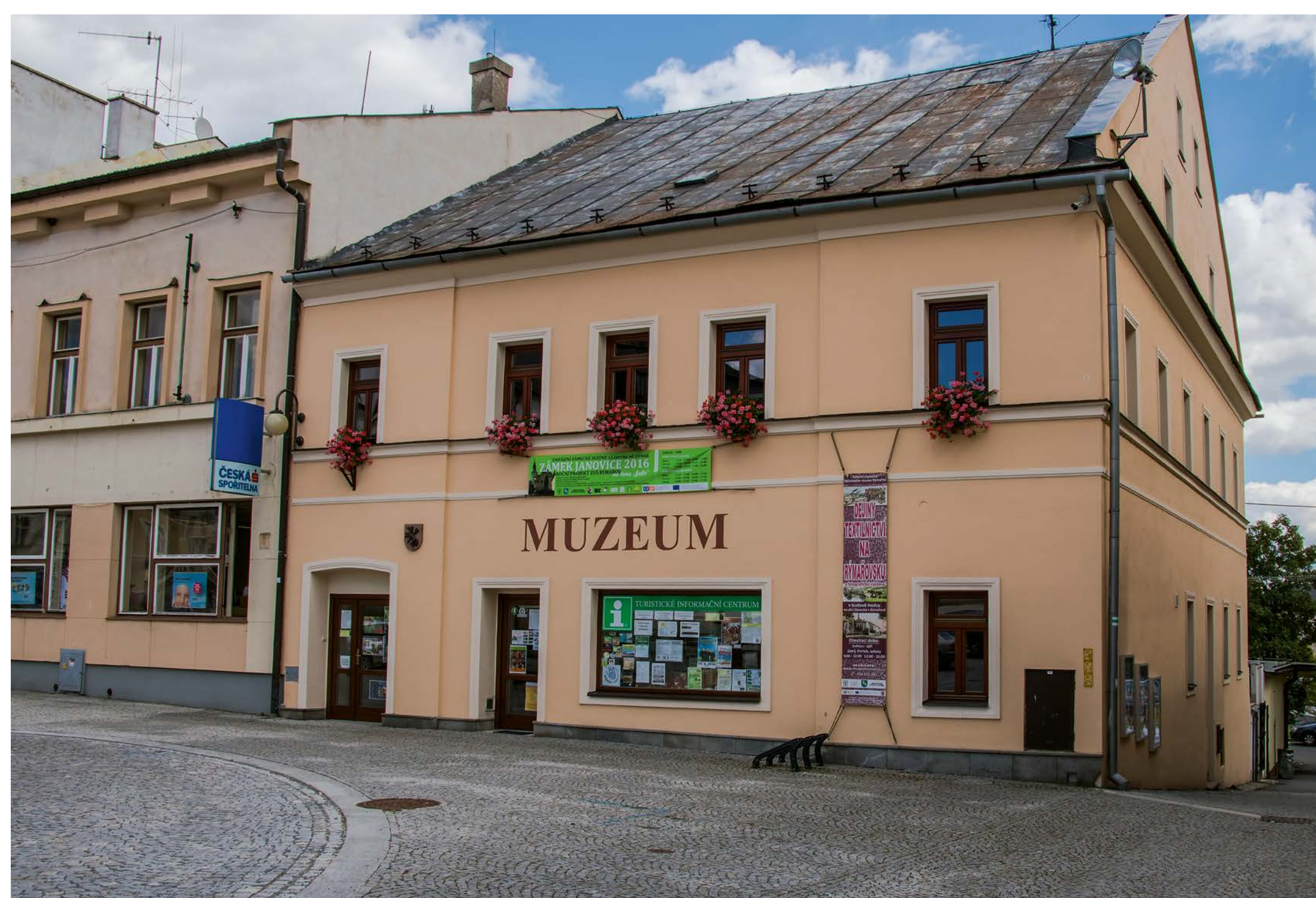
Pohled na Městské muzeum v Rýmařově 2018.