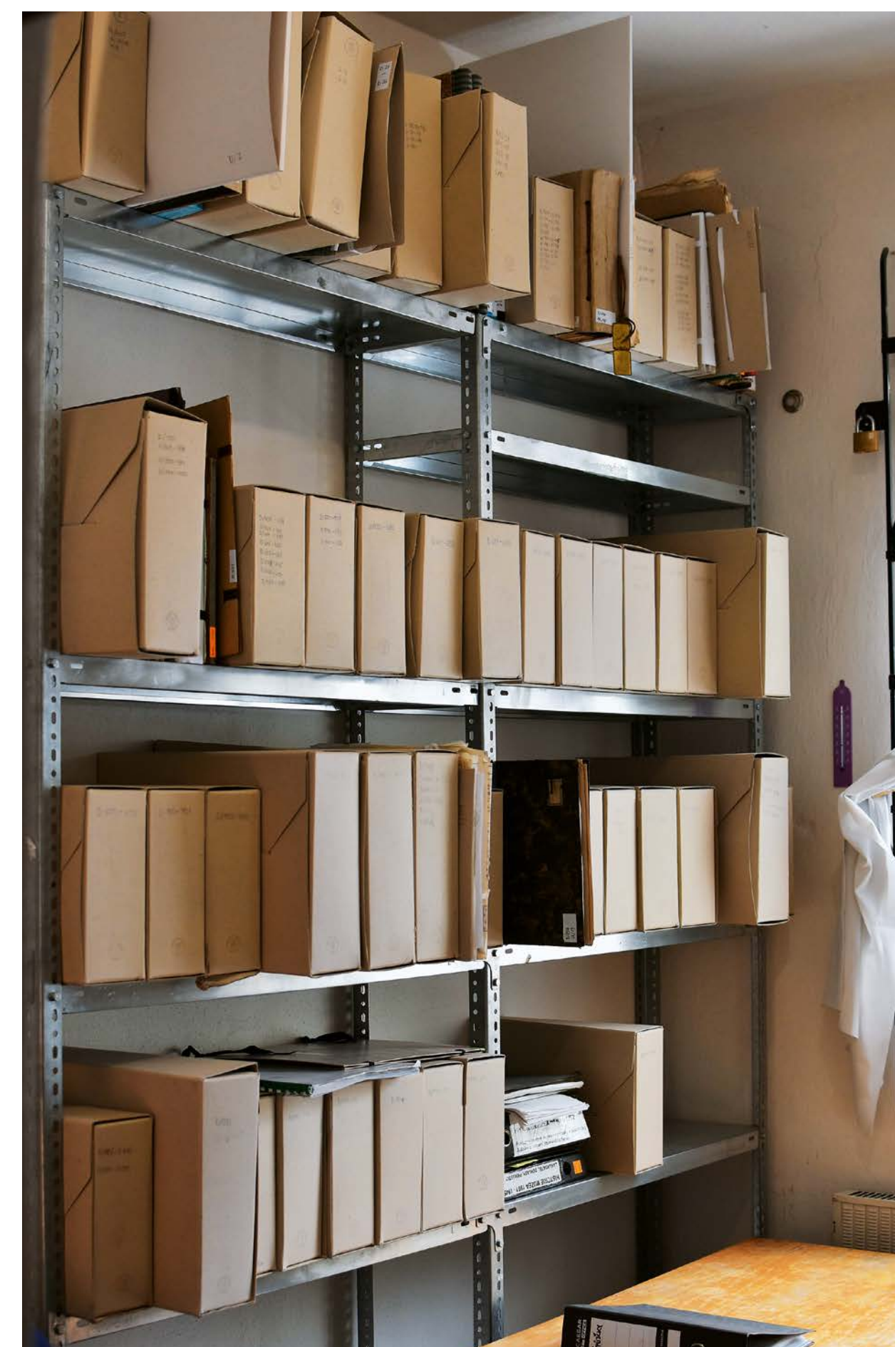
Současný pohled do archivu nalezových zpráv.