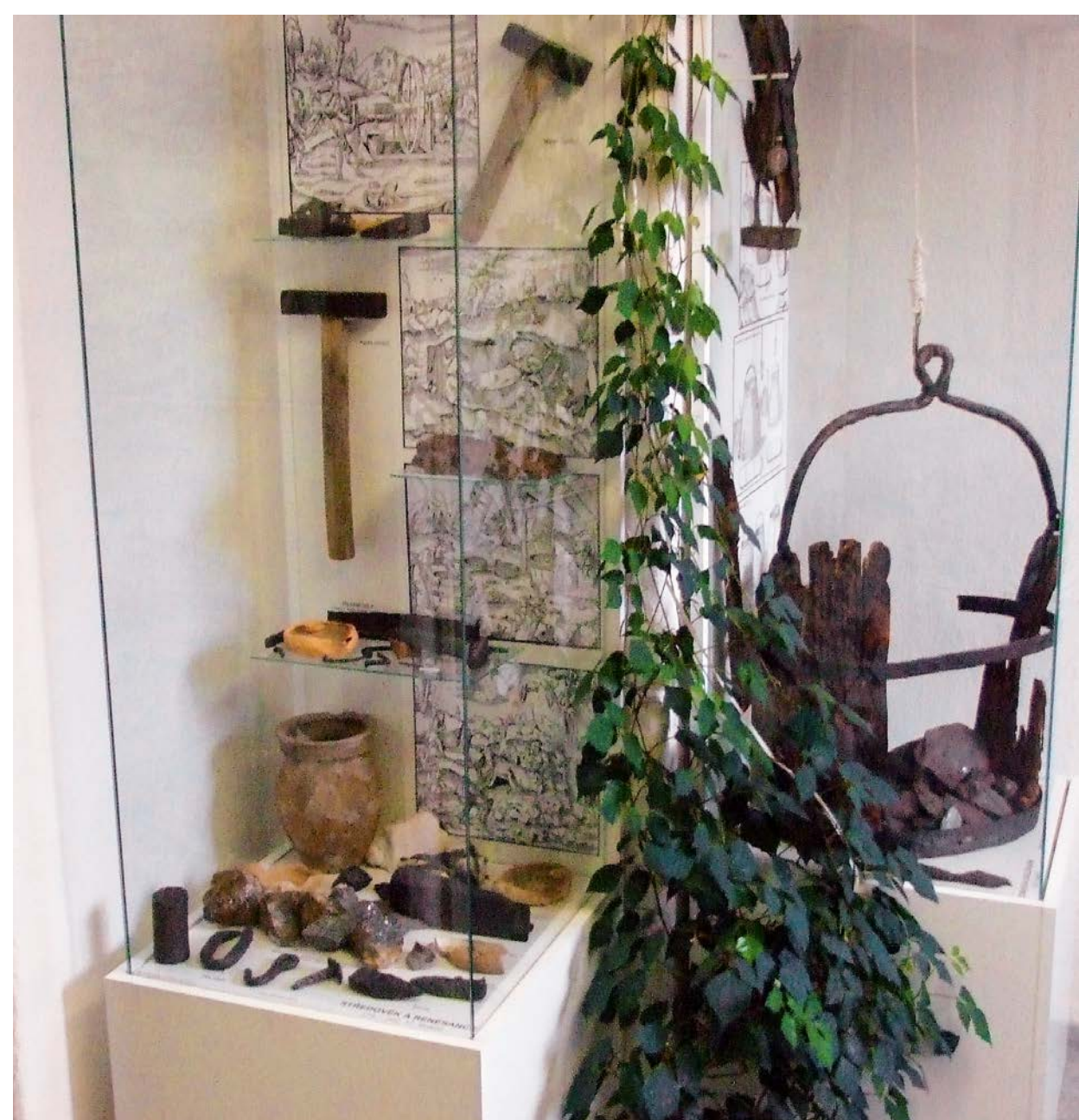
Pohled do expozice historie hornictví 2007.