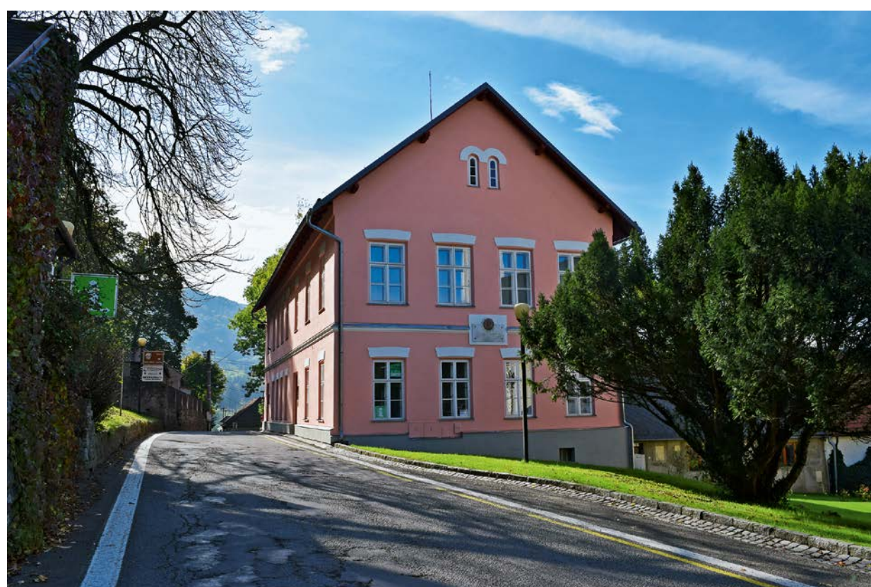
Nová stálá expozice bude umístěna v rodném domě Leoše Janáčka.