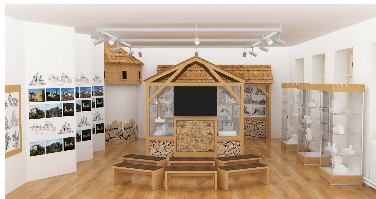
Projekt nové stálé expozice k historii hradu Hukvaldy a k hradní architektuře nazvané „Země hradů“.