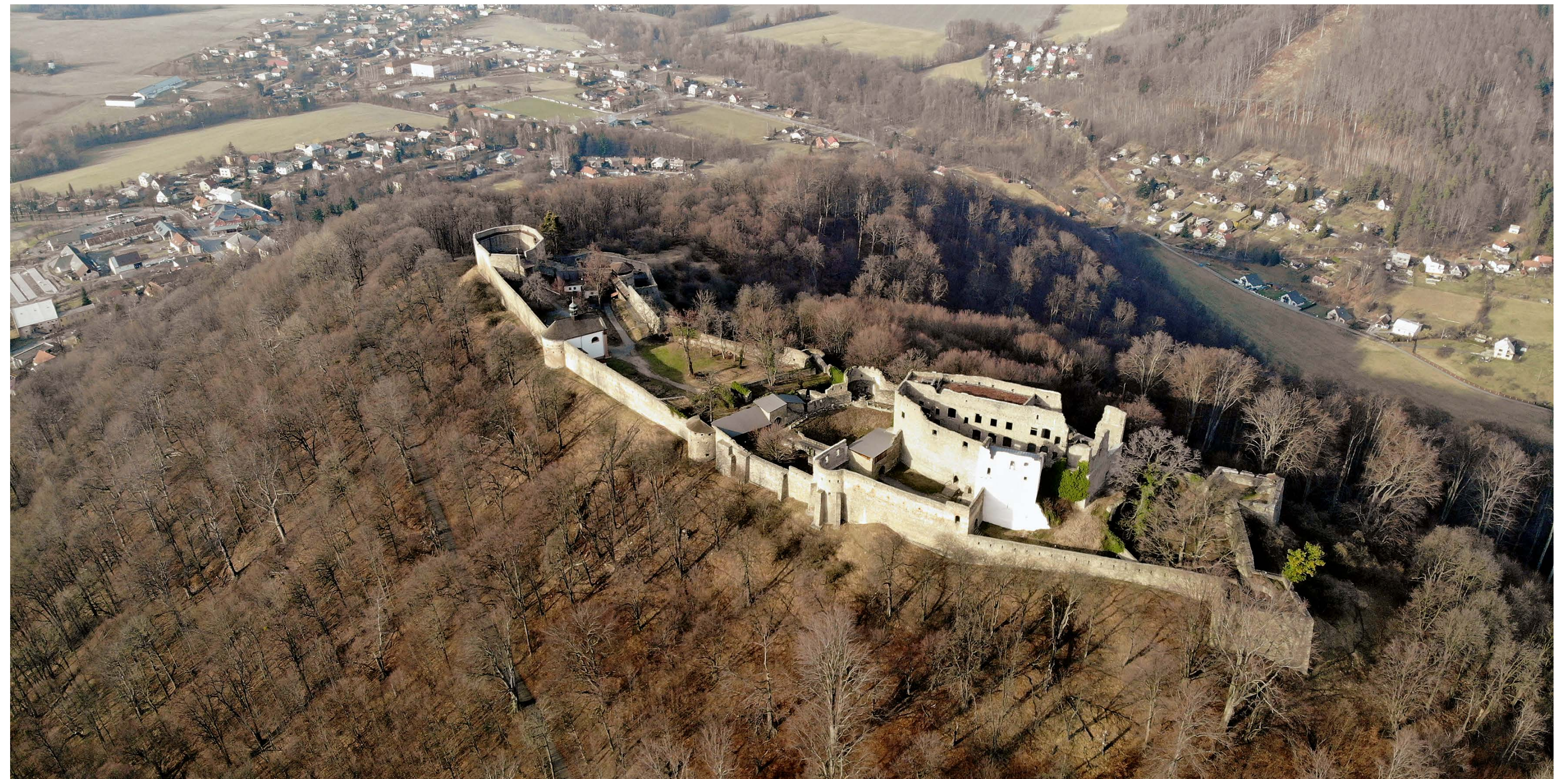
Letecký pohled na hrad Hukvaldy.