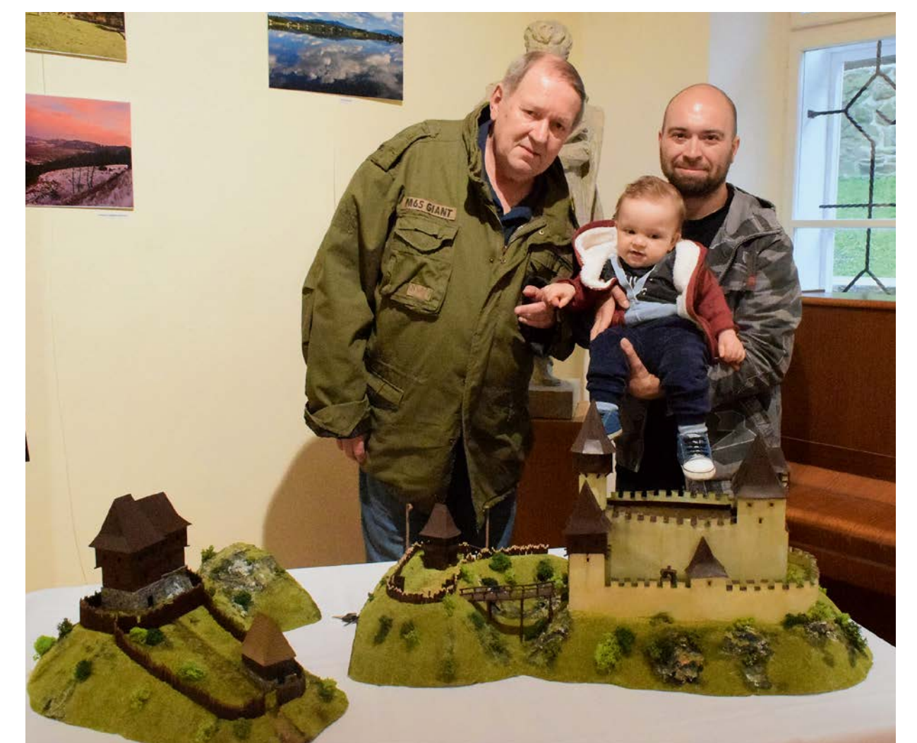
Hlavní aktéři dění v rodném domě Leoše Janáčka na Hukvaldech.