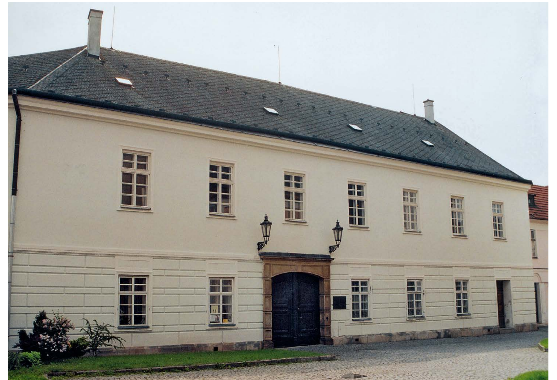
Pohled na budovu muzea v Mohelnici, v němž byla umístěna nová archeologická expozice. Foto 2007.

Také díky tomuto objevu je v prostorách muzea umístěna pamětní deska Vladimíra Kapla upomínající na jeho archeologické působení i zásluhy na vzniku muzea.