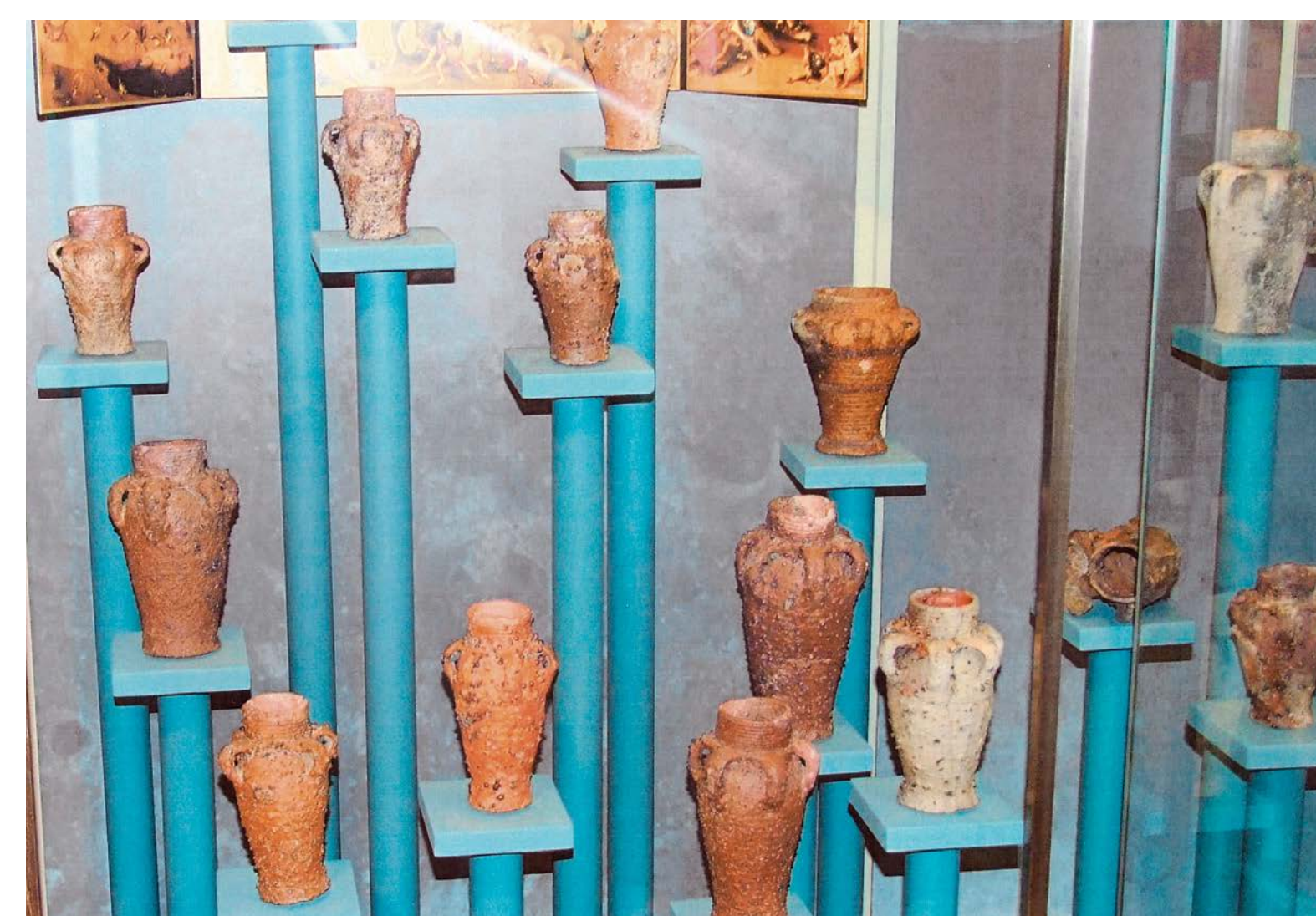
Pohledy na pozdější expozice archeologie 2007 a 2012.