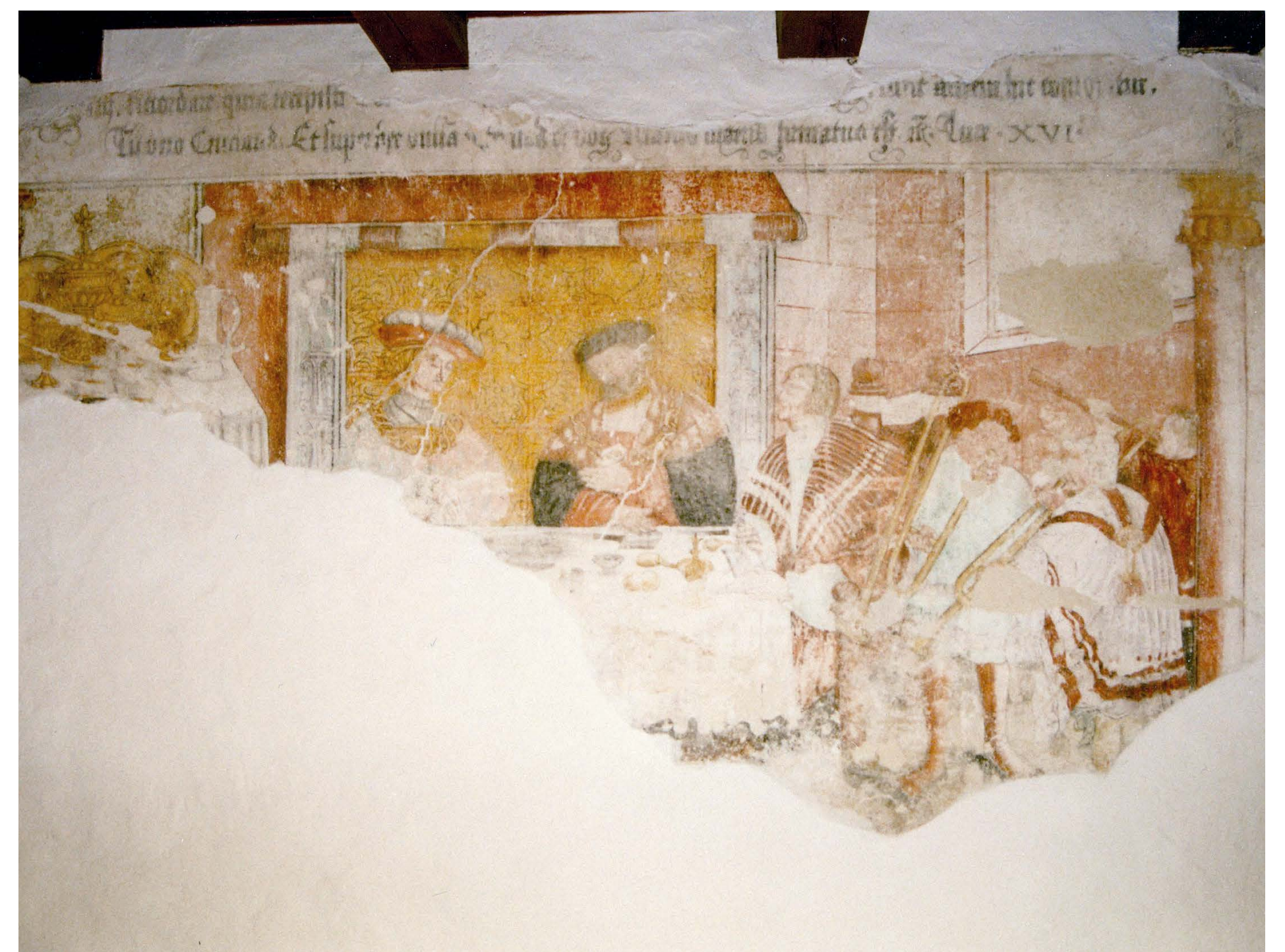
Fragment renesanční nástěnné malby, kterou našel Vladimír Kapl na půdě budovy muzea.