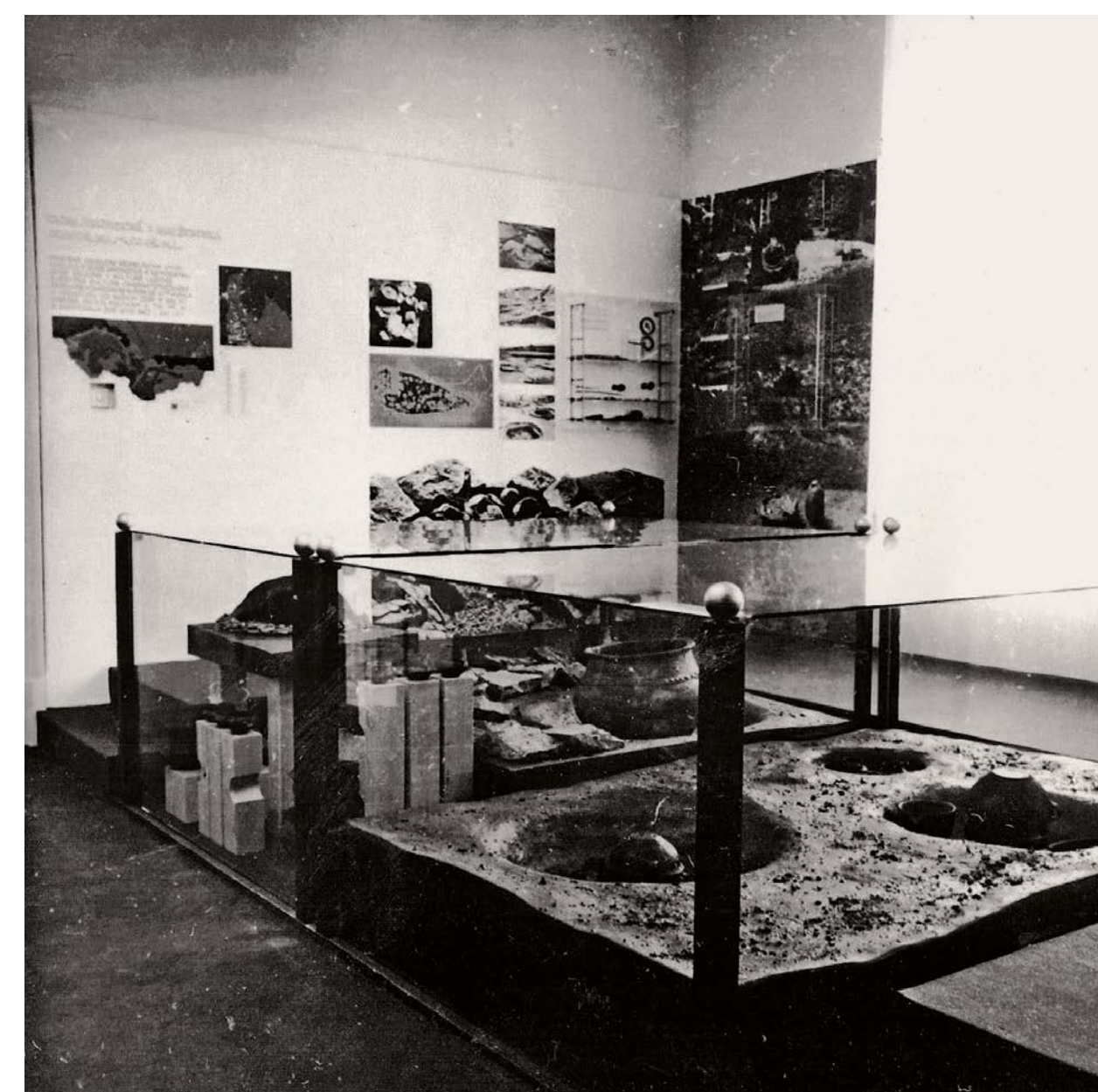
Několik fotografií ze starší archeologické expozice. Není ale jisté, že jde o nejstarší archeologickou expozici z roku 1960.