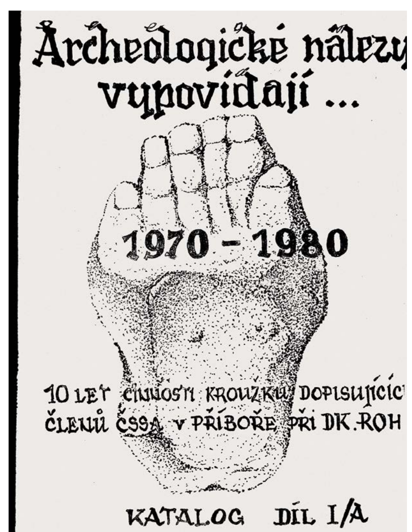
Přehled archeologických nálezů příborského kroužku před vznikem pobočky ČSSA.