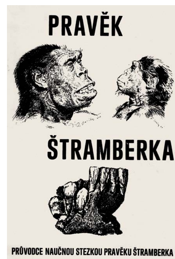
Pravěk Štamberka shrnuje dosavadní geologické a archeologické poznatky, zejména z hory Kotouče u Štamberka.