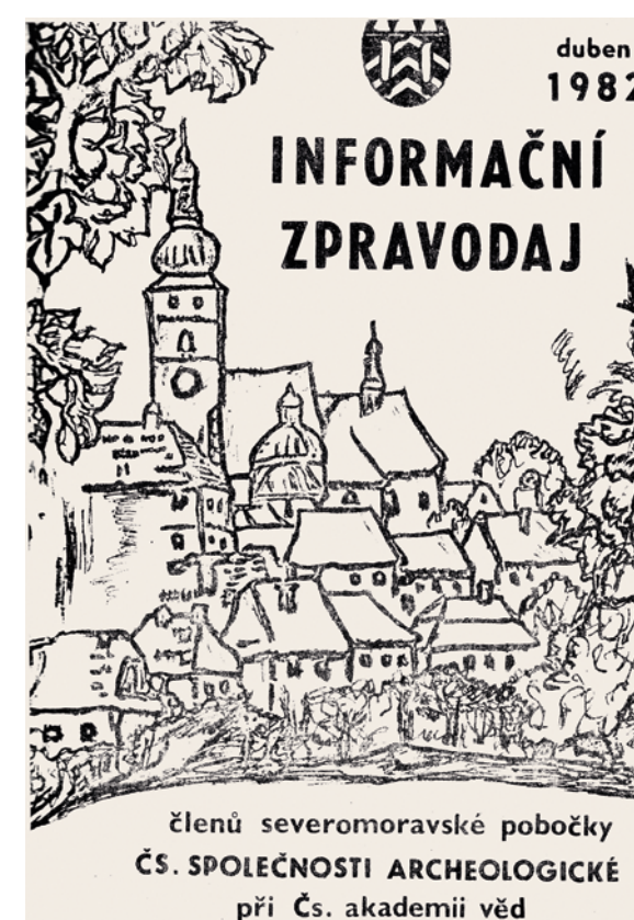
První číslo zpravodaje, o jehož sepsání a vydání se postarali členové příborského kroužku.