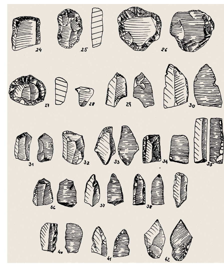
Štípaná pazourková industrie z Koprivnice-Závěšic.