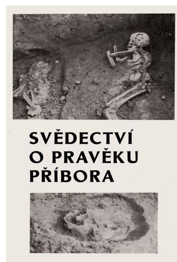
Svědectví o pravěku Příbora představuje přehled dosavadních poznatků z tohoto regionu.