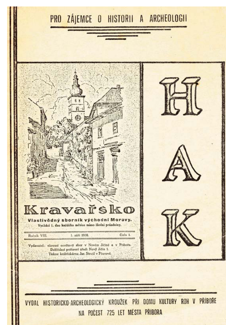
Představuje se HAK – Historicko-archeologický kroužek v Příboře při Domu kultury v Příboře.