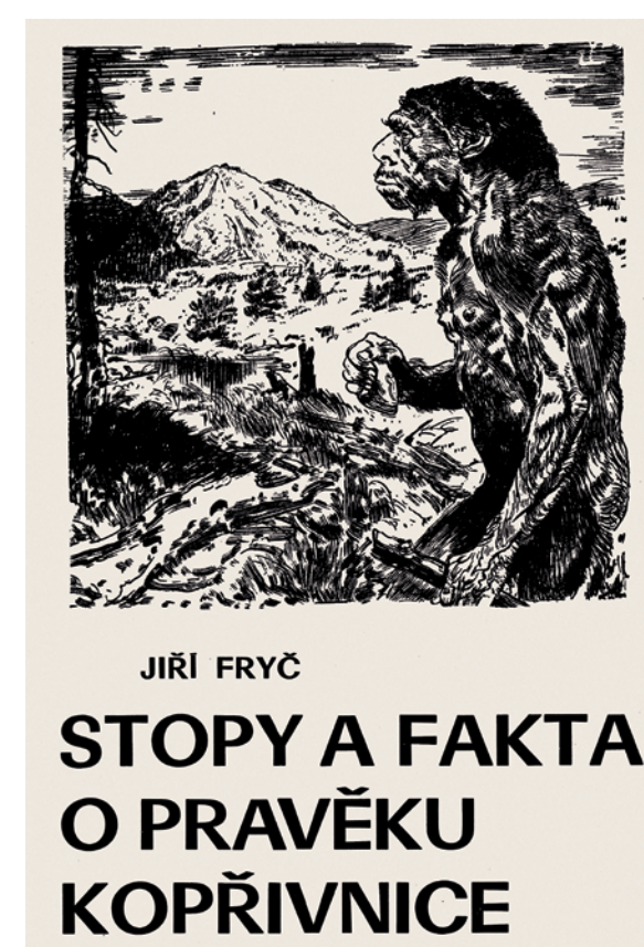
Stopy a fakta o pravěku Koprivnice představuje starší i novější archeologické nálezy nalezené v katastru Koprivnice a ve zřícenině hradu Šostýna.